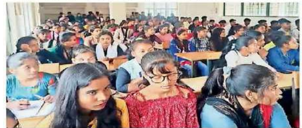
पखांजूर। गेंदसिंह कॉलेज में आयोजित कार्यक्रम में उपस्थित छात्र-छात्राएं।