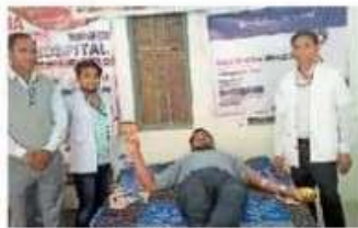
रक्तदान करते हुए कॉलेज के छात्र।