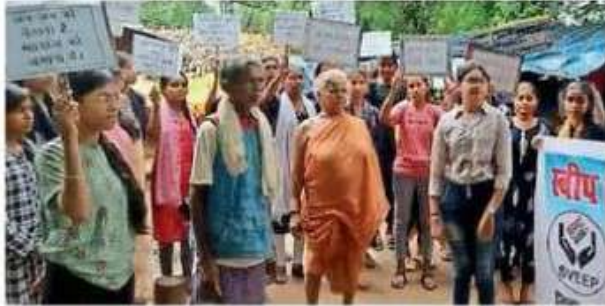
पख्वांजूर। बिटिया आग्रह टोली ने मतदाताओं से मतदान करने की अपील।

छात्राओं ने लोगों से कहा यह आपका अधिकार है और इसका वे प्रयोग करें और देश के लोकतंत्र को मजबूत करें। जनपद सीईओ राहुल रजक ने कहा की नए मतदाताओं को नाम जोड़ने के लिए वर्तमान में अभियान चल रहा है, जिसमें नए मतदाता अपने वीएलओ के माध्यम से नाम काटा- जोड़ा और संशोधित कर सकते हैं। इस दौरान कोई नया मतदाता न छूटे इसके