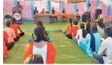
पखांजूर। कॉलेज के छात्रों को दी गई कानूनी जानकारी।