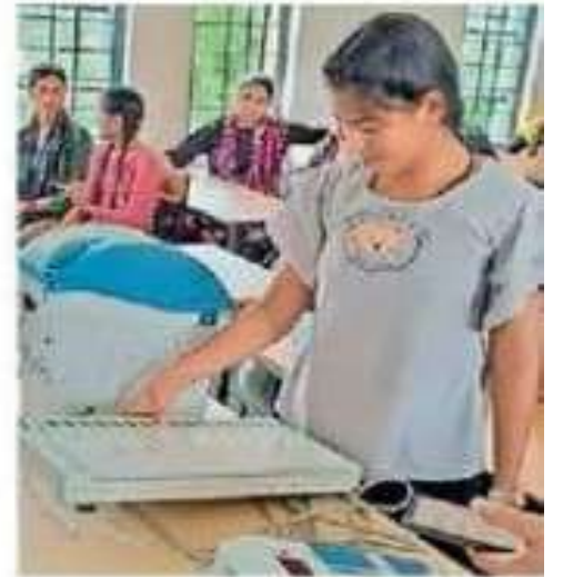
डेमो मतदान करती छात्रा।